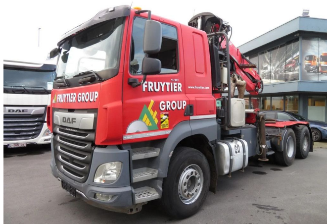
DAF CF 530 FAT WITH CRANE EPSILON PALFINGER... 6x4