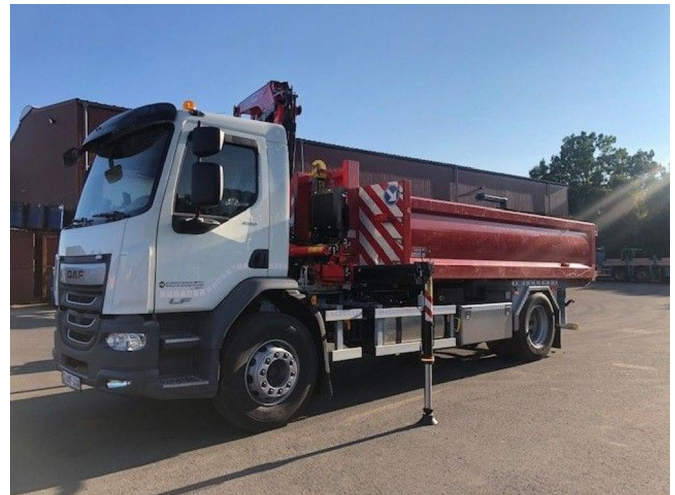
DAF LF 290 Fassi F120B.2.23 E-Dynamic + TAM T12 4x2

Referentienummer: 2AXF416 - 0L506803 - CHW KR 12