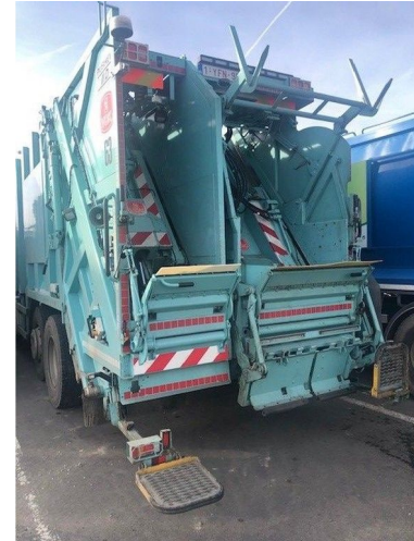
DAF CF 330 FAG as-tronic 6*2 + VDK PUSHER IIK/IID ... 6x2 Referentienummer: HVW-1166 - 1YFN958 - 0G052654