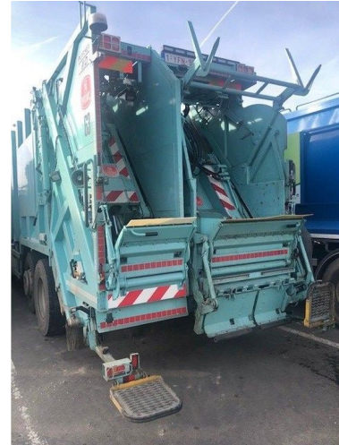
DAF CF 330 FAG as-tronic 6*2 + VDK PUSHER IIK/IID ... 6x2 Referentienummer: HVW-1166 - 1YFN958 - 0G052654