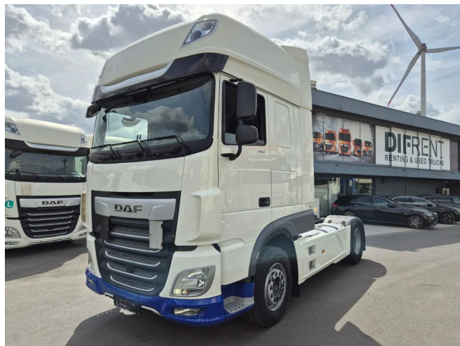
DAF XF 480 FT SUPER SPACE CAB ZF INTARDER