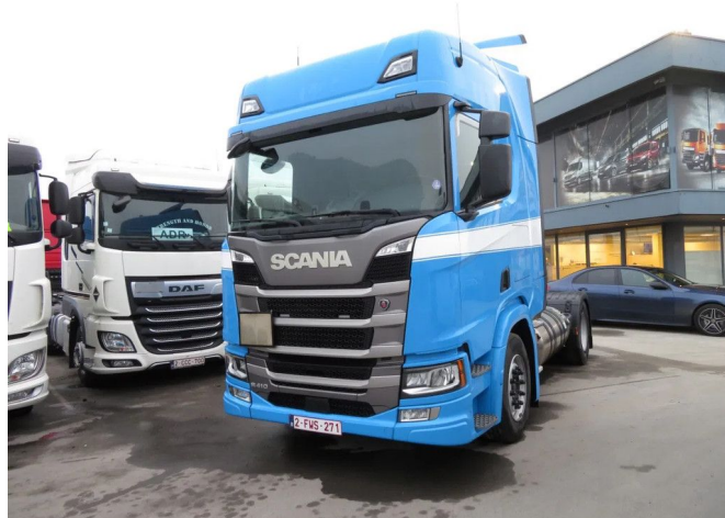
Scania R 410 LNG ADR RETARDER