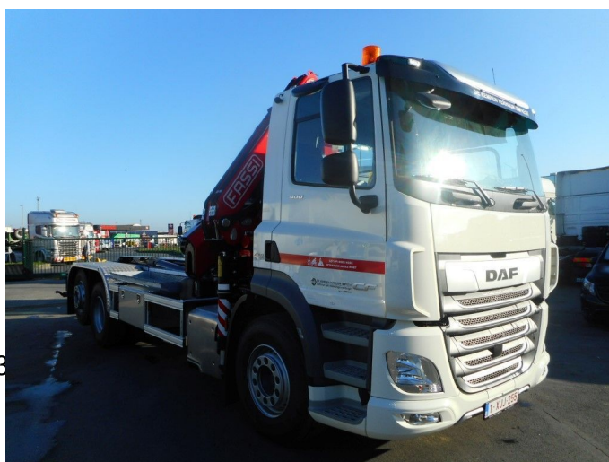
DAF CF 480 FAN - containerho... 6x2