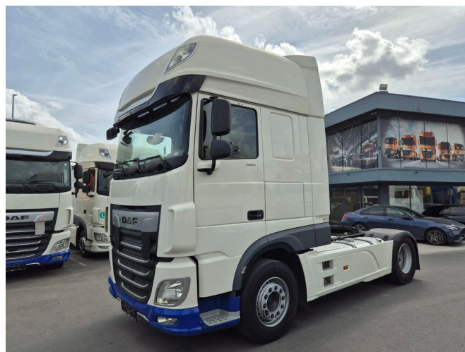
DAF XF 480 FT SUPER SPACE CAB ZF INTARDER