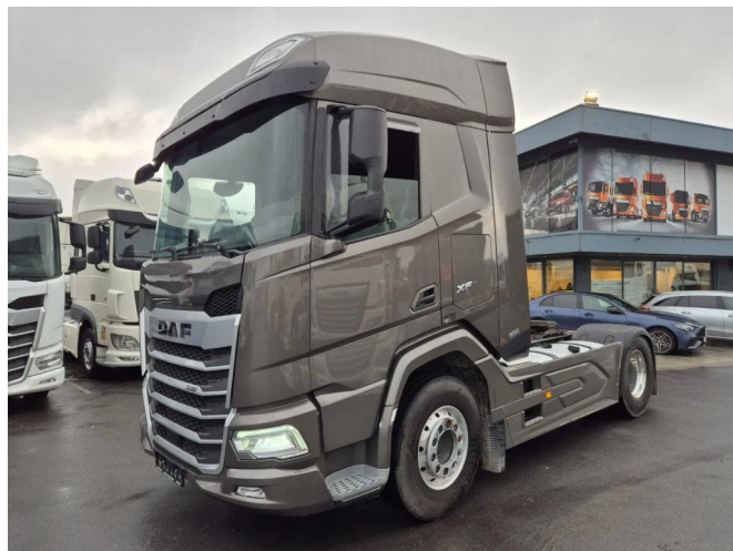
DAF XF 530 FT NGD ZF INTARDER