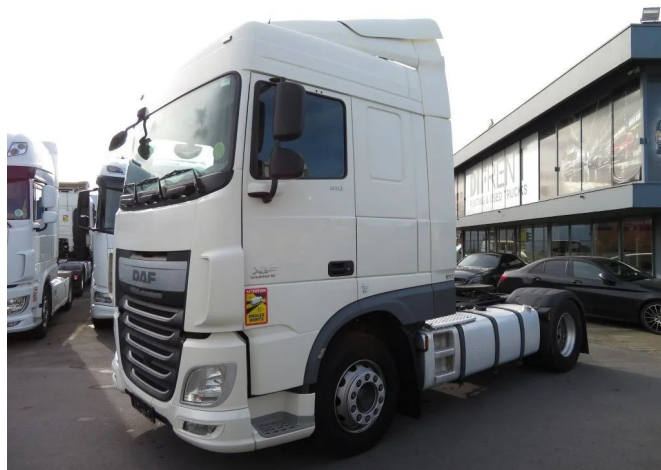
DAF XF 510 FT SPACE CAB