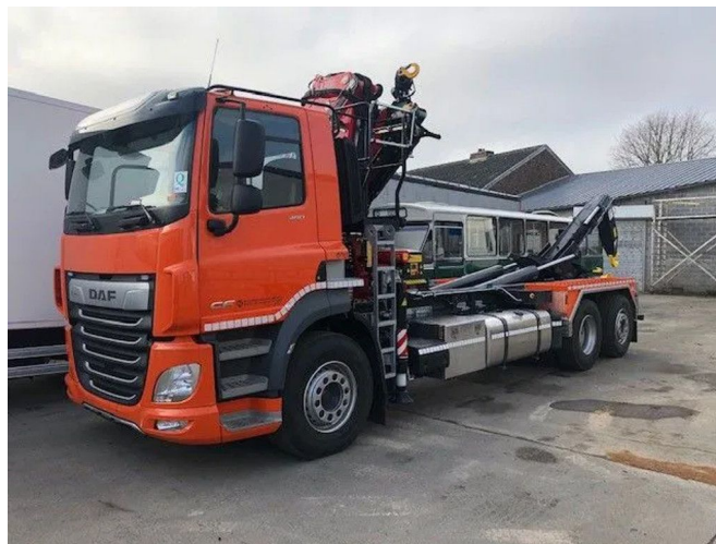
DAF CF 480 FAN WITH FASSI F235A. 2.23 E-DYNAM... 6x2

Referentienummer: CHWKR08 - 1FYD637 - 0G272540