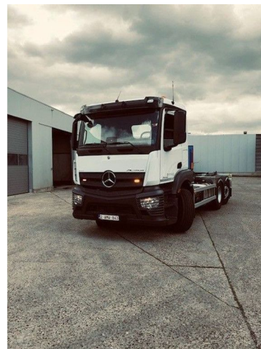
Mercedes-Benz Actros 2546 LENA AJK HL20-5760