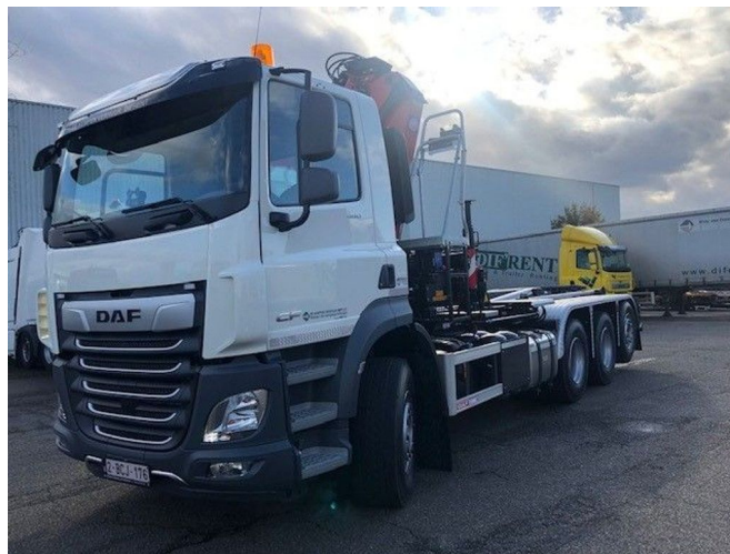
DAF CF 480 FAW 8x4 +container hook WAF 22T + crane H...

Referentienummer: DIFCHWKR14 - 2BCJ176 - 0G362045