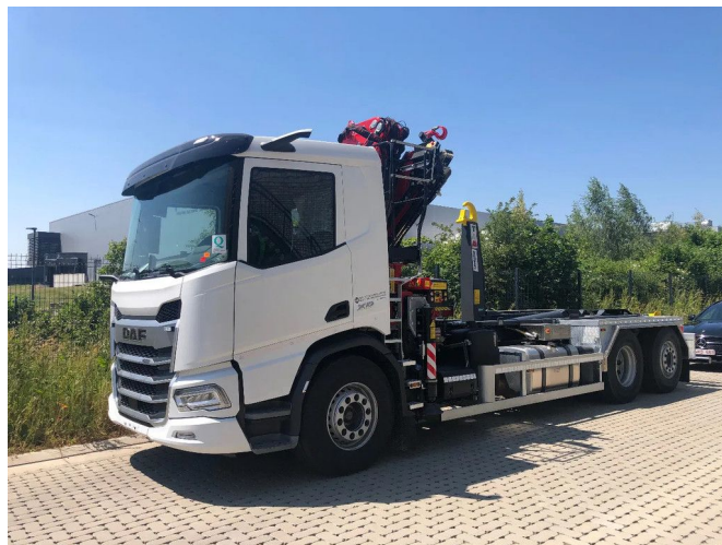
DAF XD 450 FAN FAssi F235A.2.23 E-Dynamic + TAM ... 6x2

Referentienummer: CHW-KR-11 - 2DWJ010 - 0G436698