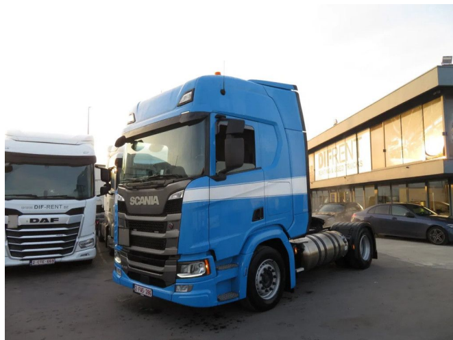
Scania R 410 LNG ADR RETARDER