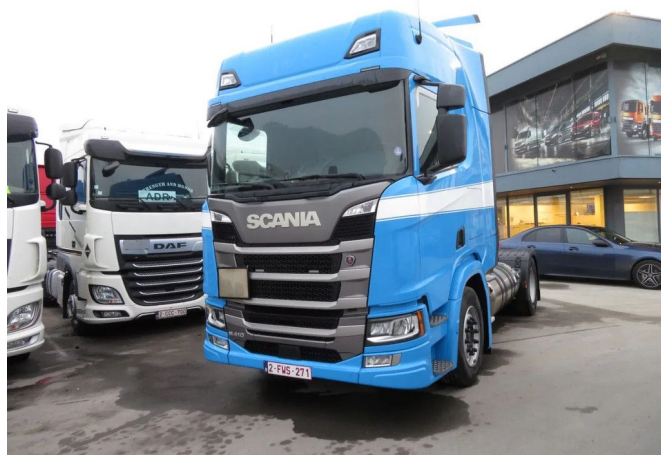
Scania R 410 LNG ADR RETARDER