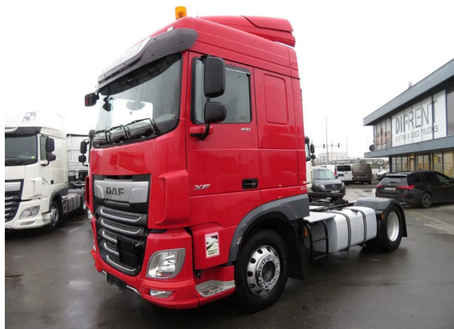
DAF XF 450 FT SPACE CAB ADR