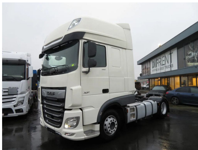
DAF XF 480 FT SUPER SPACE CAB