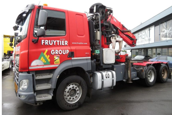
DAF CF 530 FTT WITH CRANE EPSILON PALFINGER... 6x4