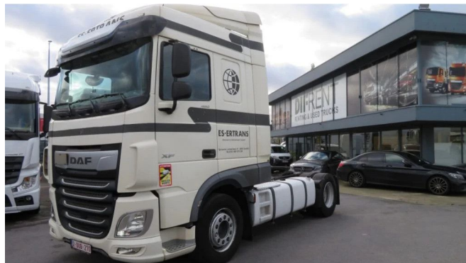
DAF XF 480 FT SPACE CAB ADR