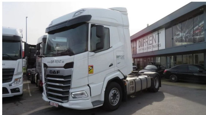
DAF XF 480 FT ADR RENTING ONLY FOR BELGIAN ... 4x2