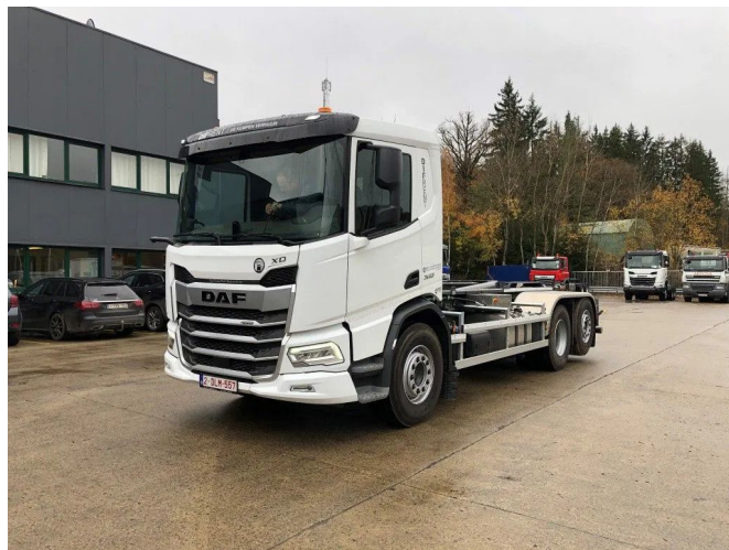
DAF XD 450 FAN 6x2 Road with HYVA Loader 20-6.2-S with...

Referentienummer: DIFCHW19 - Expected Q1 2023