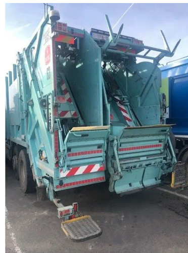
DAF CF 330 FAG as-tronic 6*2 + VDK PUSHER IIK/IID ... 6x2 Referentienummer: HVW-1166 - 1YFN958 - 0G052654