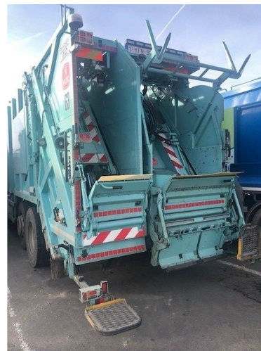
DAF CF 330 FAG as-tronic 6*2 + VDK PUSHER IIK/IID ... 6x2 Referentienummer: HVW-1166 - 1YFN958 - 0G052654