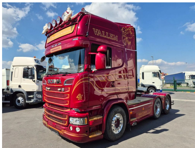
Scania R580 V8 6 X 4