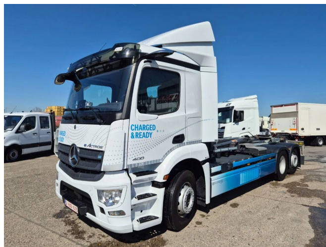
Mercedes-Benz Actros e ACTROS 400 L