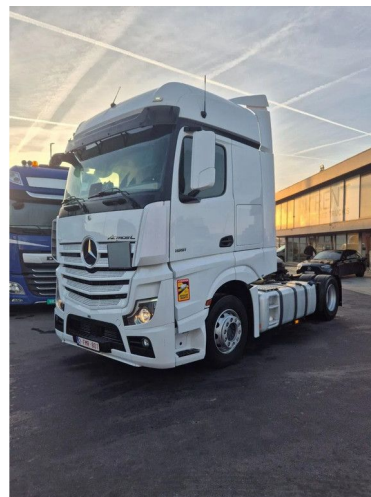
Mercedes-Benz Actros 1851 LS BIG SPACE ADR