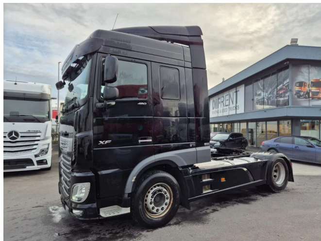
DAF XF 480 FT SPACE CAB