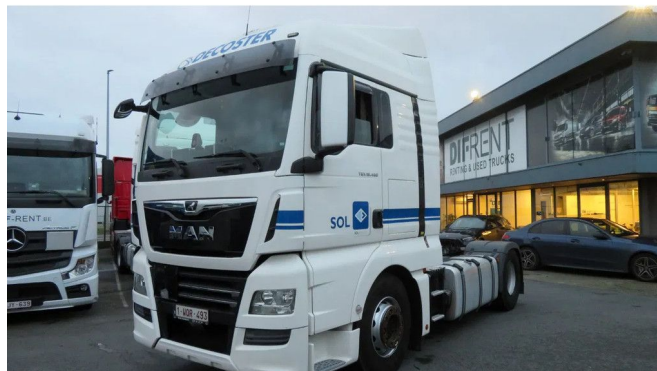
MAN TGX 18.460 ADR