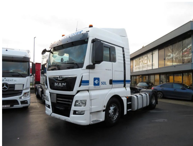
MAN TGX 18.470