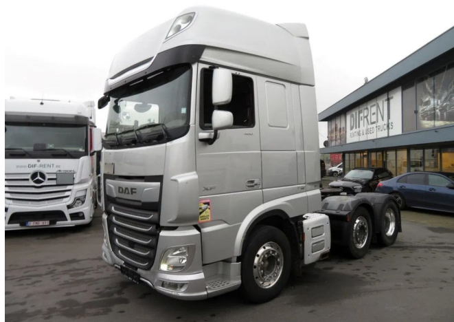
DAF XF 480 FTG SUPER SPACE CAB ZF INTARDER 6x2