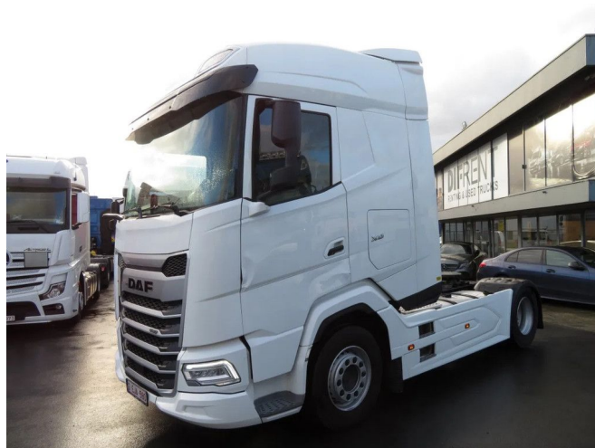
DAF XG DAF XG 480 FT ADR