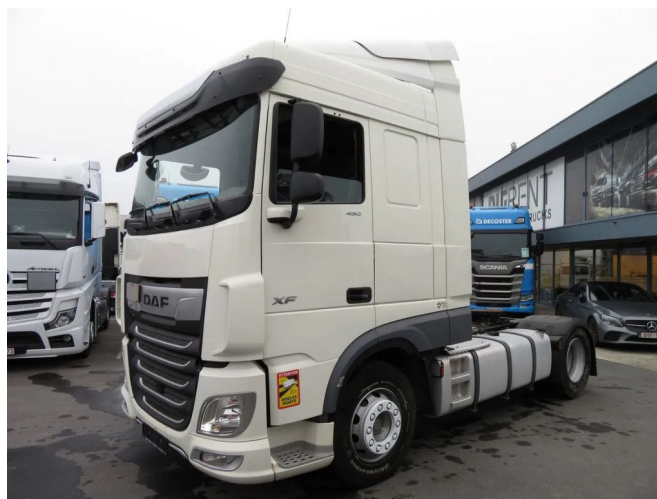
DAF XF 450 FT SPACE CAB