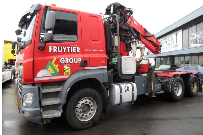
DAF CF 530 FTT WITH CRANE EPSILON PALFINGER... 6x4