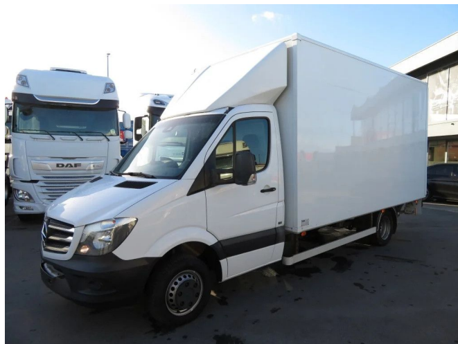
Mercedes-Benz SPRINTER 516 CDI