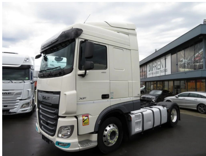
DAF XF 480 FT SPACE CAB ADR ZF INTARDER