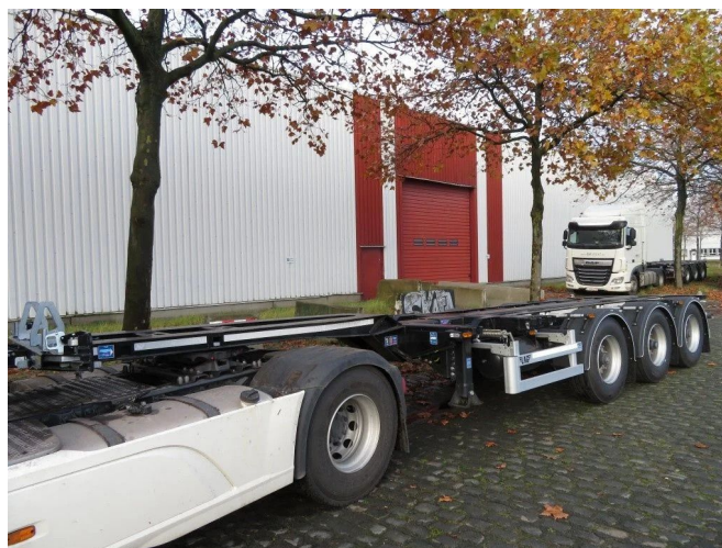
LAG UNIVERSAL SUPER SLIDER 0-3-CC